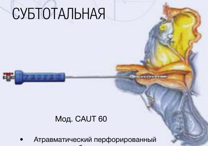
Мод. CAUT 60